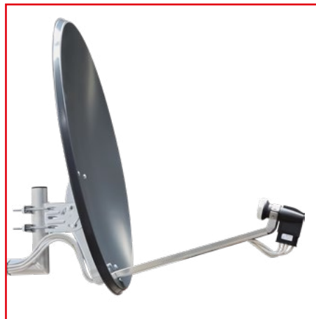
Perfekte Kabelführung im Inneren des Feedarms