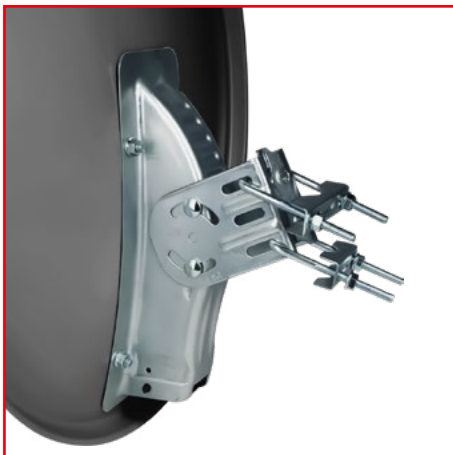
Vormontierter Halterungssatz für eine schnelle Montage