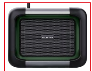
Robustes Schutzgitter schützt die Lautsprecher