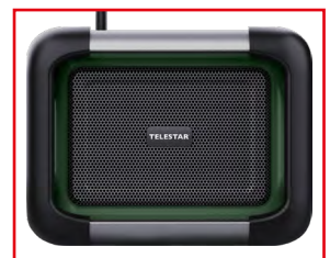
Robustes Schutzgitter schützt die Lautsprecher