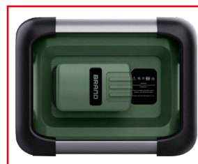
Akku-Steckplatz mit Adapter für gängige Hersteller-Akkus