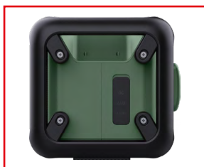
Connessioni laterali per AUX, USB e alimentazione