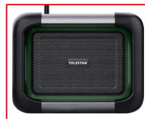
La robusta griglia protettiva protegge i diffusori