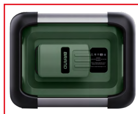
Alloggiamento per batteria con adattatore per batterie di produttori standard