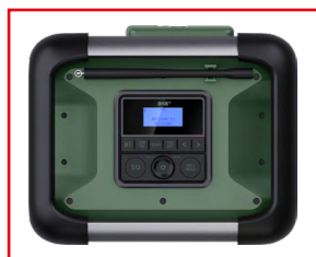
Pannello di controllo chiaro con display LCD e pulsanti funzione